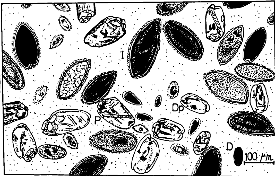
Examples of mixed rumen ciliate populations from sheep I Isotricha spp.; D Dasytricha ruminantium ; P Polyplastron multivesiculatum ; Dp Diploplastron affine

مترجمین : حسین رئیس زاده و دکتر محی الدین نیرومند