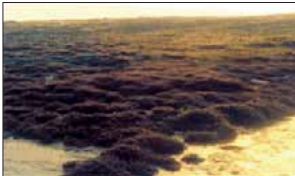
تصویر ۳- تجمع انبوه و متراکم گراسیلاریا ( G. salicorni ) در حدفاصل بخش تحتانی و میانی ناحیه بین جزر و مدی قشم.

Erythrotrichia carnea (Dillwyn) j. Agardh