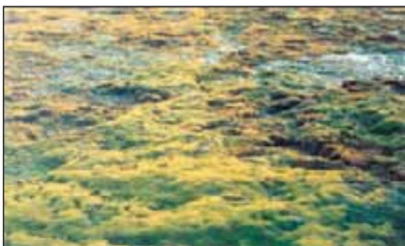
تصویر ۴- تجمع رویش‌های سبز رنگ Cladophopsis spp. در مرز بالایی رویش‌های گراسیلاریا