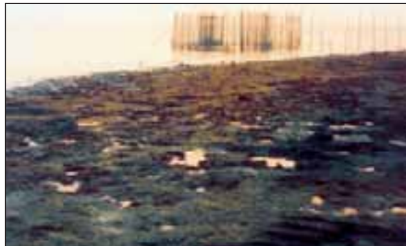
تصویر ۱- تجمع تیره رنگ رویش‌های سیانوفیسه در ناحیه واپاشی و بخش فوقانی ساحل جزر و مدی قشم.