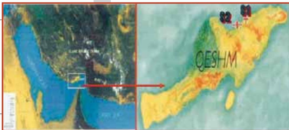
شکل ۱- موقعیت جزیره قشم در خلیج فارس و ایستگاه‌های مورد مطالعه در شمال شرق جزیره قشم

در این پروژه در دو رویشگاه گراسیلاریا ۴۹ گونه جلبکی شناسائی شد که از مجموع ۴۹ گونه شناسایی شده در دو جامعه G. salicornia ، ۲۵ گونه به جلبک‌های قرمز ( Rhodophyceae )، ۱۰ گونه به جلبک‌های قهوه‌ای ( Phaeophyceae )، ۱۱ گونه به جلبک‌های سبز ( Chlorophyceae ) و ۳ گونه به جلبک‌های سبز-آبی