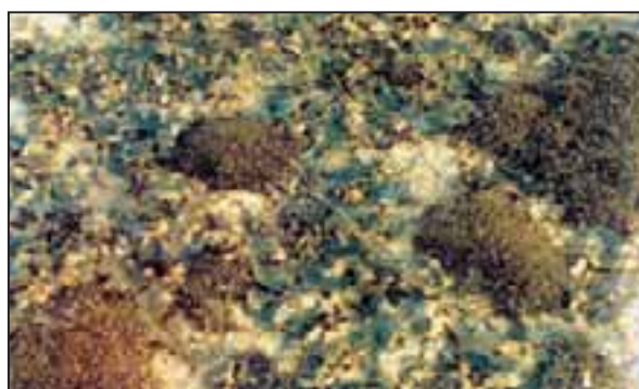
تصویر ۲- تجمع جلبک قهوه‌ای Padina spp. در مرز بالایی کمر بند Gracilaria salicorni