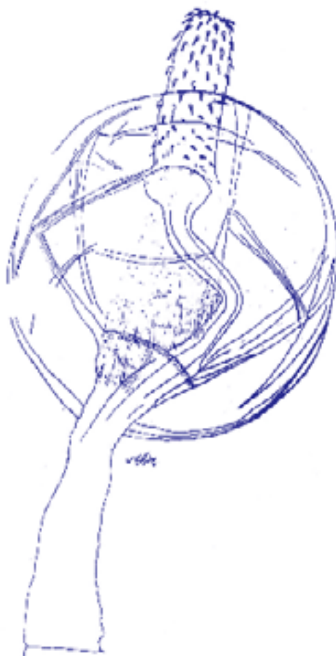
عکس شماره دو: انتهای قدامی ترسیمی انگل P.laevis یافت شده (ترسیم: دانشکده بهداشت دانشگاه تهران)

17-Yildiz, K. 2003; Helminth infections in tench from Kapulukaya Dam Lake, Turk. J. Vet. Anim. Sci., 27, 671-675