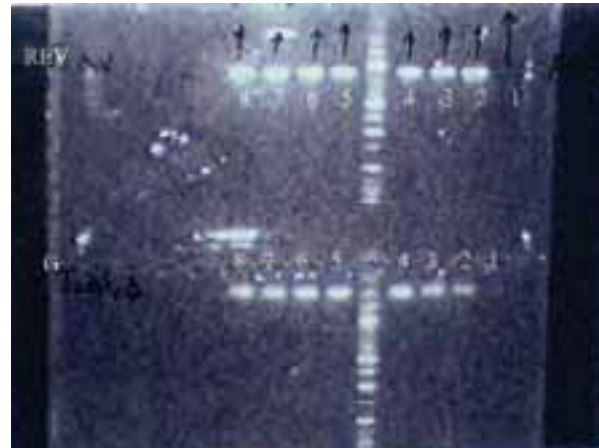
شکل ۴: تعیین بهترین غلظتی از MgCl 2 برای هر دو جفت پرایمر G1/G2 و REV/DIR1/590 ۱-۰.۵mm، ۲-۱mm، ۳-۱.۲۵mm، ۴-۱.۵mm، ۵-۱.۷۵mm، ۶-۲mm، ۷-۲.۵mm، ۸-۳mm

سکانس هدف و اتصال غیر اختصاصی نیز افزایش می‌یابد و پرایمردایمر نیز ایجاد می‌گردد که باعث می‌شود تا پرایمرها با خودشان به صورت دوتایی اتصال یابند. در غلظت‌های کم (۰/۵ mm) مورد استفاده هیچ باند و محصول PCR ای ایجاد نگردید وجود یون منیزیم برای فعالیت آنزیم Taq DNA Polymerase نیز ضروری است (۱۶).