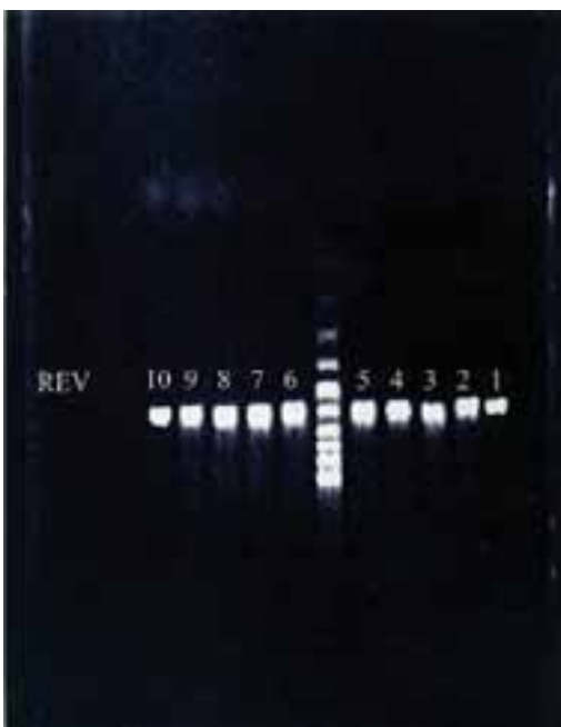
شکل ۳: تعیین غلظت مناسب از پرایمر DIR1/REV2 در واکنش PCR

لازم به ذکر است که استفاده از روش‌های سرولوژیک نیاز به گذشت دوره زمانی بیماری و پاسخ ایمنی مناسب در بدن دارد از طرف دیگر روش‌های سرولوژیک موجود، وجود پادتن بر علیه لپتوسپیروسیس را نشان داده و وجود لپتوسپیروسیس را نمی‌توانند نشان دهند در حالی که PCR می‌تواند وجود لپتوسپیروسیس را حتی در روزهای اول آلودگی نشان دهد (۱۹، ۲۳). اولین گزارش موجود بدین منظور در سال ۱۹۸۹ توسط Van Eys انجام پذیرفت. در مطالعه‌ای که Brown در سال ۱۹۹۵ انجام داد نتیجه گرفت PCR می‌تواند لپتوسپیروسیس را در مراحل حاد عفونت لپتوسپیروسیس نشان دهد و روش با ارزشی جهت تشخیص لپتوسپیروسیس در مراحل اولیه می‌باشد. در این تحقیق سعی گردید با راه اندازی و طراحی PCR جهت تشخیص لپتوسپیروسیس پاتوژن امکان تشخیص زودرس لپتوسپیروسیس فراهم آید.