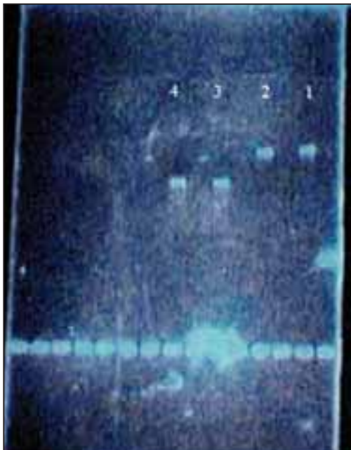
شکل ۱: واکنش زنجیره‌ای پلیمرز (PCR) و ۲- پرایمر ۳، G1/G2 و ۴- DIR1/590REV2

PCR برای شناسایی تعداد وسیعی از میکروارگانیسم‌ها از جمله آنهایی که از لحاظ کلینیکی حائز اهمیت هستند استفاده