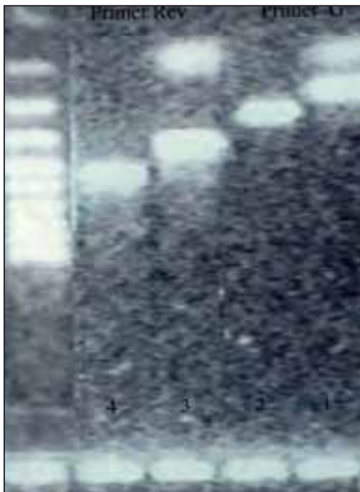
شکل ۶: تائید محصول PCR با RFLP ۱- MboI، و ۲- کنترل، و ۳- AluI، و ۴- کنترل

توالی DNA انتخاب شده اختصاصی لیتوسپیرا بود. با توجه به اینکه شانس وجود داشتن اتفاقی یک توالی در مولکول DNA از رابطه n^4 محاسبه می‌گردد (n = تعداد نوکلئوتیدها) و پرایمرهای مورد استفاده در اینجا ۲۰ mer بوده‌اند این شانس معادل ۱ در ۱۱۰ Gbp می‌باشد. کل ژنوم لیتوسپیرا حدود ۵ Mbp می‌باشد. احتمال تکرار تصادفی این توالی تقریباً معادل صفر می‌باشد (۱۳، ۱۱). جهت بررسی شباهت این پرایمر با توالی باکتری‌های دیگر، به صورت عملی با برنامه BLAST بانک ژن نیز بررسی گردید. به طور کلی هیچ ژنومی غیر از لیتوسپیرا پاتوزن با این پرایمرها همولوژی کامل نداشتند ولی تعدادی از باکتری‌ها که دارای همولوژی نسبی بودند انتخاب گردید. باکتری‌ها شامل Bacillus subtilis ، Escherichia coli ، Listeria monocytogenes و Staphylococcus aureus بود که از بانک میکروبی موسسه رازی تهیه و سپس با کشت و استخراج DNA از آنها PCR صورت گرفت که هیچکدام با این روش PCR قابل تشخیص نبودند. پرایمرهای G1 و G2 به ترتیب از انتهای ۵' و انتهای ۳' توالی پلاسمید