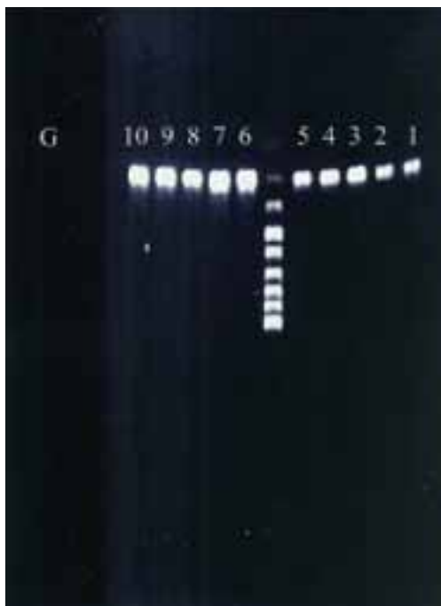
شکل ۲: تعیین غلظت مناسب از پرایمر G1/G2 در واکنش PCR

نتایج نشان داد که بهترین کیفیت DNA در استخراج با فنل، کلروفرم، ایزوآمیل الکل بدست آمد. این DNA در الکتروفورز بر روی ژل آگارز حداقل اسمیر را داشت و به صورت باند قوی بر روی ژل ظاهر می‌گردد. ظاهراً روش جذب DNA بر روی فیبرهای شیشه به دلیل ماهیت جذبی آن از طریق اتصالات الکترواستاتیک با جذب قطعات کوچک و بزرگ DNA بالاترین راندمان استخراج را دارد منتها میزان اسمیر آن به دلیل وجود قطعات کوچک بیشتر می‌باشد. در حالیکه به دلیل عدم امکان رسوب قطعات کوچک در روش فنل، کلروفرم، ایزوآمیل الکل DNA استخراج شده دارای راندمان کمتر ولی کیفیت و یکنواختی بیشتر است. در این تحقیق غلظت‌های مختلفی از یون منیزیم در محلول PCR بکار گرفته شد. غلظت مناسب Mg^{2+} ، ۱/۵ mm بدست آمد. در غلظت‌های بالاتر منیزیم قدرت اتصال پرایمرها افزایش، در نتیجه اتصال پرایمرها به