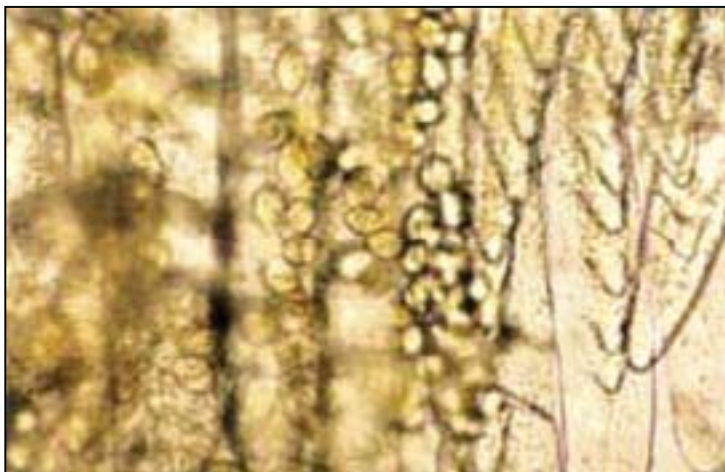
تصویر ۱- کلنی‌های ژئوتامنیوم بر روی برانش میگو (بزرگنمایی ۱۰×)