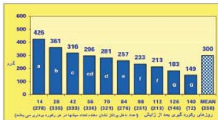
نمودار ۴- میانگین تولید شیر روزانه در دوره‌های شیردهی به روش دست دوش در سه سال (۱۳۷۷-۱۳۷۵)

گروه‌های سنی دیگر شیر بیشتری تولید کردند که معمولاً با زیاد بودن فاصله سنی میش‌ها، اثر سن بر تولید شیر معنی‌دار می‌شود و میش‌های ۳، ۴ و ۵ ساله از لحاظ تولید شیر با همدیگر تفاوت معنی‌داری ندارند (۹). میش‌های با پنجمین شکم بیشترین و میش‌های با اولین شکم کمترین شیر تولیدی را داشتند که تفاوت تولید آن‌ها معنی‌دار بود (۱).