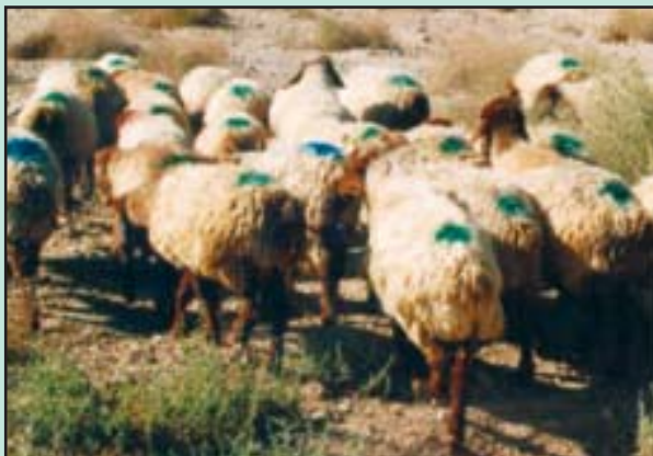
تصویر ۲- گروه‌بندی میش‌ها براساس هفته زایش