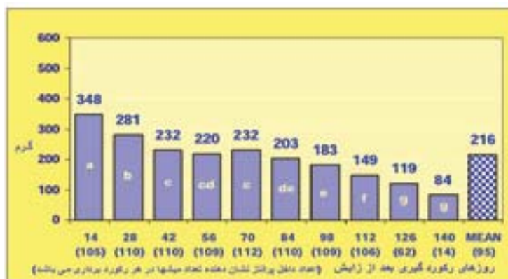
نمودار ۳- میانگین تولید شیر روزانه در

با توجه به نمودارهای ۱ تا ۴، اثر دوره‌های شیردهی بر تولید شیر در سال‌های تحقیق معنی‌دار بود ( P < 0.05 ). در این مورد اثر سال به عنوان متغیر کمکی استفاده شد. با افزایش دوره شیردهی در تمام سال‌ها شیر تولیدی کاهش یافت. بیشترین مقدار شیر تولیدی مربوط به دوره اول (روز ۱۴ بعد از زایش) در سال ۱۳۷۵ با میانگین ۵۰۸ گرم در روز برای ۷۰ رأس میش و کمترین آن مربوط به دوره دوم (روز ۱۴۰ بعد از زایش) در سال ۱۳۷۷ با میانگین ۸۴ گرم در روز برای ۱۴ رأس میش بود.