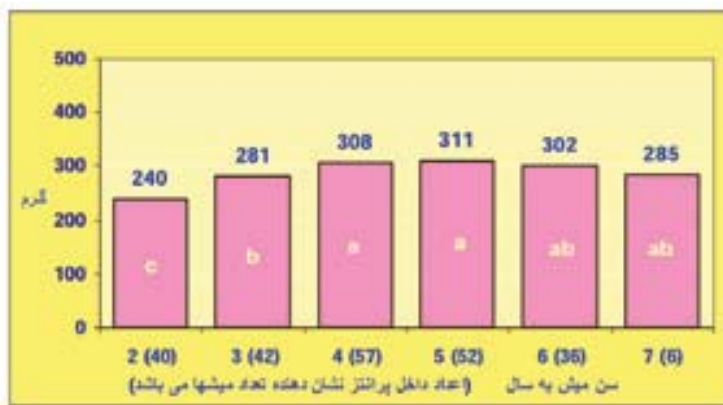
نمودار ۵- میانگین تولید شیر روزانه در دوره‌های شیردهی به روش دست دوش در سه سال (۱۳۷۷-۱۳۷۵)