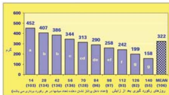
نمودار ۲- میانگین تولید شیر روزانه در دوره‌های شیردهی به روش دست دوش در سال ۱۳۷۶

نوسانات تولید شیر گله‌های گوسفند بومی فارس بدلیل نوسانات بارندگی قابل پیش‌بینی و منطقی است. در یک گزارش اثر سال بر شیر تولیدی معنی‌دار بوده است (۱).