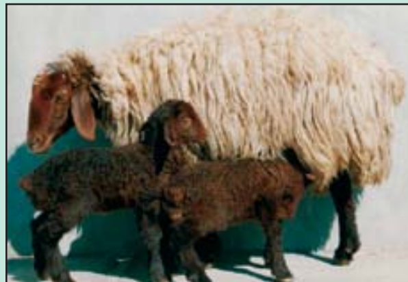
تصویر ۱- گوسفند ترکی قشقایی

تولید شیر گله در مدت سه سال تفاوت معنی‌داری داشت ( P < 0.05 ) و در سال‌های ۱۳۷۵ لغایت ۱۳۷۷ به ترتیب ۳۶۳، ۳۲۲ و ۲۱۶ گرم و بطور میانگین برای سه سال ۳۰۰ گرم در یک دوره شیردهی ۱۴۰ روزه بود (نمودارهای ۱ تا ۴). در این مورد اثر سن به عنوان متغیر کمکی استفاده شد. دلیل کاهش تولید شیر گله در سال ۱۳۷۷ را می‌توان کاهش بارندگی و در نتیجه کاهش علوفه مرتعی عنوان کرد.