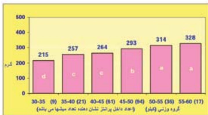
نمودار ۶- میانگین تولید شیر روزانه در دوره‌های شیردهی به روش دست دوش در سه سال (۱۳۷۷-۱۳۷۵)

(۲۱ رأس)، ۴۰ تا ۴۵ کیلو (۶۱ رأس)، ۴۵ تا ۵۰ کیلو (۹۴ رأس)، ۵۰ تا ۵۵ کیلو (۳۶ رأس) و ۵۵ تا ۶۰ کیلو (۱۷ رأس) به ترتیب ۲۱۵، ۲۵۷، ۲۶۴، ۲۹۳، ۳۱۴ و ۳۲۸ گرم بود. با افزایش طول دوره شیردوشی، مقدار شیر تولیدی در تمامی گروه‌های وزنی کاهش نشان داد. میش‌های ۵۵ تا ۶۰ کیلوگرمی بیشترین شیر تولیدی را نشان دادند که احتمالاً به دلیل توان بالای جسمانی بوده است.