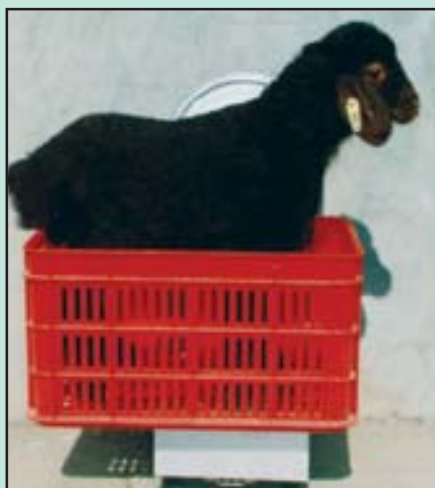
تصویر ۳- توزین بره‌ها قبل و بعد از شیرخوردن

در ساعت ۶ بعد از ظهر بره‌ها از مادر جدا و در ساعت ۶ صبح روز بعد، ابتدا پستان راست دوشیده و مقدار شیر دوشیده‌شده توزین و ثبت گردید. سپس بره توزین شده (تصویر ۳) و به مدت نیم ساعت در کنار مادر قرار گرفت و مجدداً جدا و وزن شد. تفاوت وزن قبل و بعد از شیرخوردن ثبت گردید. سپس بره‌ها جدا و میش‌ها به چرا برده شد. در ساعت ۶ عصر همان روز مجدداً همان گروه جدا و پستان چپ دوشیده و مقدار شیر دوشیده‌شده توزین و ثبت گردید. سپس بره توزین و به مدت نیم ساعت در کنار مادر قرار گرفت و مجدداً جدا و وزن شد. تفاوت وزن قبل و بعد از شیرخوردن ثبت شد. مقدار شیر دوشیده‌شده و مکیده‌شده صبح و عصر به عنوان کل شیر تولیدی منظور شد.