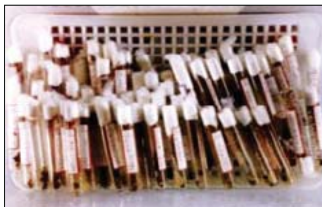
شکل شماره ۱ - نوزاد کنه B. annulatus در لوله کشت

به منظور تهیه پاکت‌های کاغذی از فیلتر کاغذی واتمن شماره ۴ به ابعاد ۱۰ در ۸ سانتیمتر استفاده گردید که این قطعه کاغذ از قسمت میانی