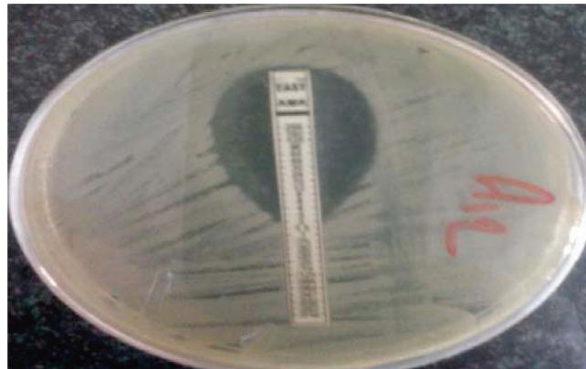
شکل ۱- نتیجه آزمون تعیین حداقل غلظت ممانعت از رشد MIC با استفاده از نوار E.test

نمودند (۲۰). جیانگ و همکاران در بررسی خود سال (۲۰۱۵) بر روی ۲۲۷۵۹ نمونه شیر گاوهای مبتلا به ورم پستان‌های تحت بالینی، میزان آلودگی به سودوموناس آئروژینوزا را ۶۲/۵۵ درصد گزارش نمودند (۱۳). قبولی و همکاران در پژوهش سال (۱۳۹۱) بر روی باکتری‌های ایجادکننده ورم پستان دوره خشکی در تبریز به این نتیجه رسیدند که ۱۳/۳۲ درصد نمونه‌ها آلوده به سودوموناس آئروژینوزا می‌باشند (۱۱). در تحقیق حاضر نمونه‌ها به صورت تصادفی انتخاب نگردید، لیکن بر اساس محل جغرافیایی مشخص گردید که میزان آلودگی شیر گاوهای مبتلا به ورم پستان‌های با ویژگی‌های تحت بالینی ۳۴ درصد بوده که این میزان فراوانی با توجه به نتایج مطالعات فوق همخوانی نداشته که علت این امر می‌تواند ناشی از منطقه جغرافیایی مورد مطالعه، ضعف مدیریت مزارع، وجود آبهای آلوده و یا مخازن آلوده به این باکتری، تفاوت روش‌های جداسازی و شناسایی