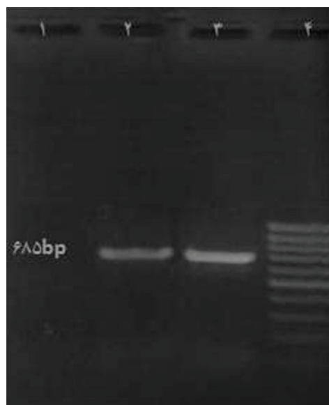
شکل ۳- الکتروفورز محصول PCR ژن ۱۶ srRNA گونه‌ی Aeromonas hydrophila بر روی ژل آگارز ۱/۵٪. ستون ۱- کنترل منفی، ستون ۳- کنترل مثبت، ستون ۴: نردبان ژنی ۱۰۰(M) bp. ستون ۲: جدایه‌ی مظنون به Aeromonas hydrophila (۶۸۵ bp)

۱۲۵ جدایه‌ای که از نظر جنس Aeromonas تایید شده بودند و شامل همه ۵۹ جدایه تشخیص داده شده به عنوان Aeromonas hydrophila با تست‌های بیوشیمیایی بودند، مورد آزمایش PCR با استفاده از پرایمرهای اختصاصی Aeromonas hydrophila (ژن‌های لیپاز و ۱۶s rRNA) قرار گرفتند. نتایج