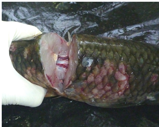
شکل ۱- دسترسی به کلیه از طریق برش از ناحیه پشتی

پس از بیومتری و ثبت علائم بالینی، ابتدا سطح بدن بوسیله الکل ۷۰٪ ضدعفونی شد و سپس با استفاده از یک اسکالپل استریل کالبدگشایی صورت گرفت بدین صورت که یک برش عرضی جلوی مخرج داده شد، سپس بوسیله یک قیچی استریل، برش را از قسمت جلوی مخرج به سمت ناحیه شکمی سر ادامه داده و تا سرپوش آبششی خاتمه می‌یابد. برش دوم از مخرج شروع شده و از سطح پشتی جلویی به سمت خط جانبی ادامه می‌یابد. استخوانهای نزدیک کمان آبششی بریده شده و بوسیله برش سوم انتهای دو برش اول و دوم بهم متصل می‌شود. اما برای نمونه گیری استریل از کلیه یک برش از ناحیه پشتی داده می‌شود (شکل ۱). در نهایت از اندام‌های داخلی (کلیه، کبد و طحال) و ضایعات جلدی احتمالی نمونه‌برداری می‌گردد.