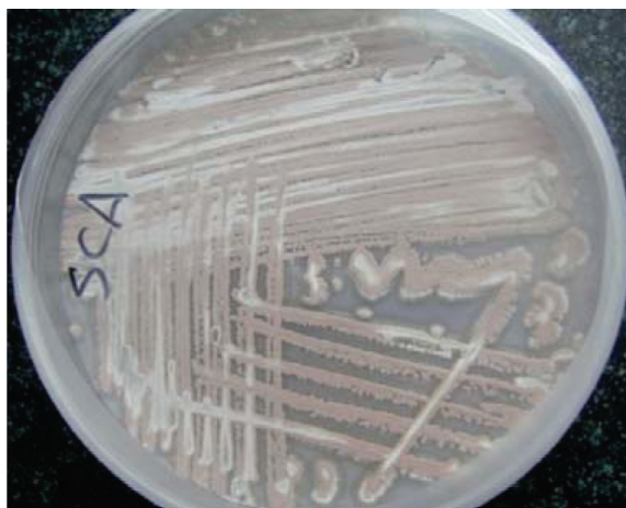
شکل ۱- نمونه‌ای از Streptomyces جدا شده

برای K_2Cr_2O_7 و رقت های ۱۰۰۰-۶۰۰-۶۰۰ (۶۰۰، ۷۰۰، ۸۰۰، ۹۰۰ و ۱۰۰۰) برای CdCl_2 تهیه گردید. در چاهک اول میکروپلیت های ۹۶ چاهکی، 1\mu از رقت بالای فلز مورد نظر و در چاهک های بعدی رقت های پایین تر به ترتیب انتقال داده شد و چاهک آخر با 1\mu از محیط MHB بدون فلز به عنوان شاهد تهیه شد. در چاهک ها 5\mu از سوسپانسیون باکتری تلقیح گردیده سپس میکروپلیت ها به مدت ۴۸ ساعت در دمای 28^\circ C نگهداری و بعد از این زمان، به صورت چشمی کدورت بررسی شد، اولین چاهک فاقد کدورت برای هر استرپتومایسس به عنوان MIC در نظر گرفته شد. حداقل غلظت کشندگی MBC به عنوان کمترین غلظت هر فلز که به طور کامل باعث مرگ باکتری ها می شد با کشت دادن 10\mu از چاهک های فاقد کدورت در محیط ISP2 تعیین گردید.