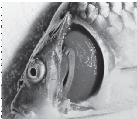
شکل ۲- صفحه آبششی ماهی سیم آلوده به داکتیلوژیروس