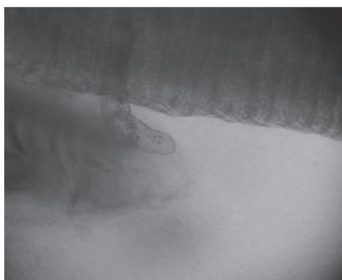
شکل ۳- صفحه آبششی ماهی نیز کولی آلوده به داکتیلوژیروس (۱۰X)